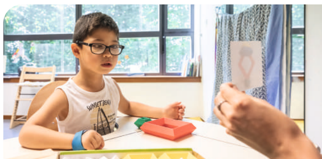
Schéma national d'organisation sociale et médico-sociale 2021-2025